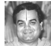
Sri Venugopal Goswami

4 jours exceptionnels de chants spirituels, musique et paroles de sagesse à partir de l'étude de ce texte sacré sur l'amour divin. avec Sri Venugopal Goswami, maître de Nada Yoga de Vrindavan en Inde du Nord.