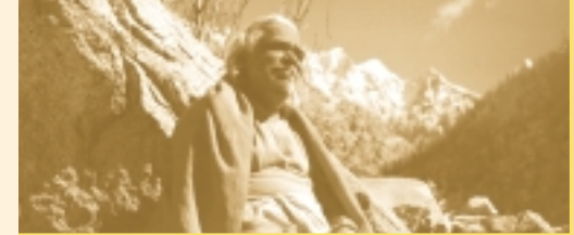
Swami Vishnu-devananda in den Himalayas