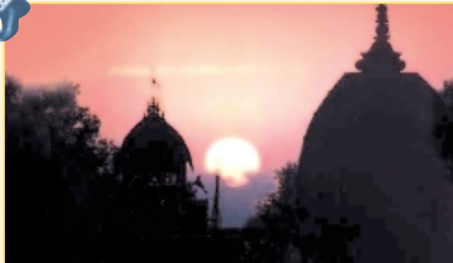
Sonnenaufgang über den Tempeln Vrindavans

Vrindavan befindet sich 150 km von Delhi, und ist in 2 Stunden auf dem Highway NH2, einer der modernsten Straßen Indiens, zu erreichen. Agra und das Taj Mahal sind 30 km entfernt.